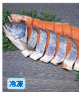
006 極上紅鮭切身 約2.3kg 9,800円