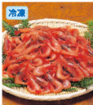
042 北海甘えび 500g 1,800円