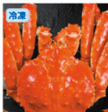
002 本タラバ姿 1尾・約1.5kg 9,000円