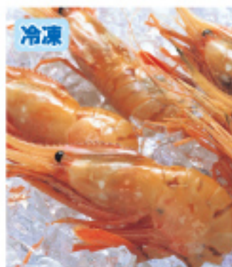
023 ほたんえび 約500g 4,000円