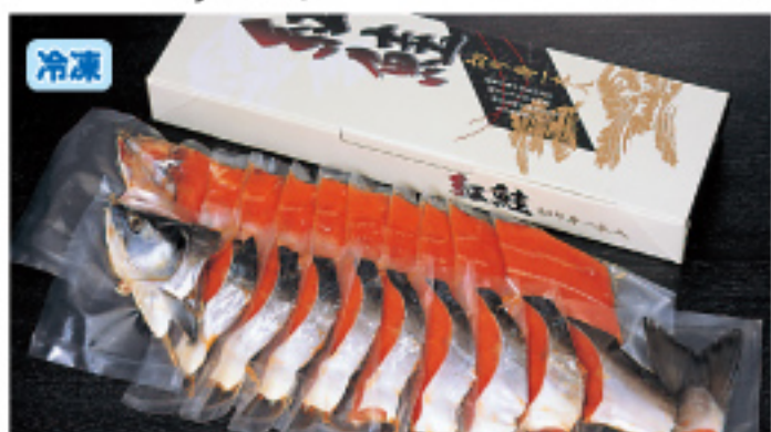
005 極上紅鮭切身 約1.8kg 7,800円