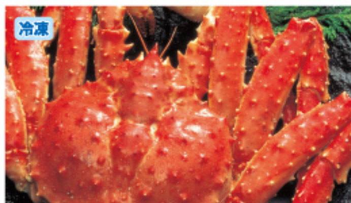
016 本タラバ姿 1尾・約1~1.2kg 5,200円