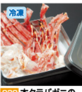
030 本タラバガニの ガンガンセット タラバ2尾・生しゃぶ(約1kg) [カニが生1箱] 化粧箱付 6,800円