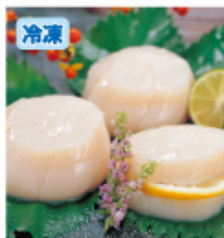
024 お刺身用 ほたて貝柱 約500g 3,500円