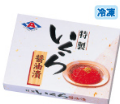
019 いくら醤油漬 500g 5,000円