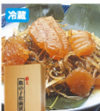
029 献上数の子松前 500g×2木箱入 3,900円