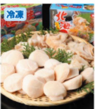
025 お刺身セットA ほたて貝柱500g 北海つば貝500g 3,800円