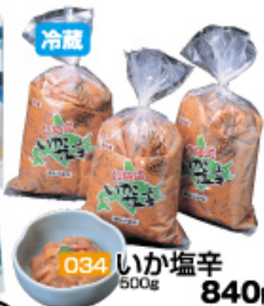
034 いか塩辛 500g 840円