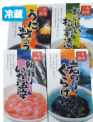
033 生珍味4点セット うに数の子・松前漬・いか塩辛・岩のりくらげ 2,100円