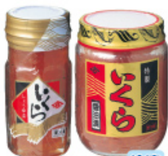
036 80g 1,000円 037 200g 2,700円