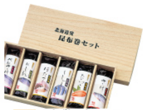
047 昆布巻6本セット 紅さけ・にしん・ぼたて・ししゃも・たらこ・さけ 3,150円