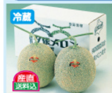
008 夕張メロン 2玉 6,000円 発送時期/7月中旬～