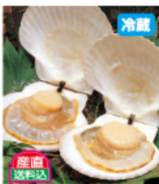
022 産直活ホタテ 15枚入 4,800円