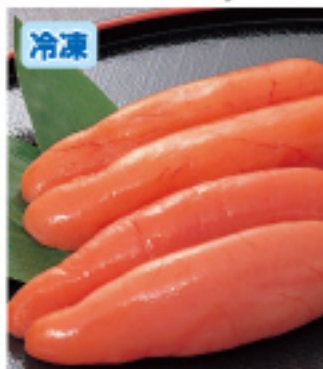
038 甘口たらこ 250g 2,100円