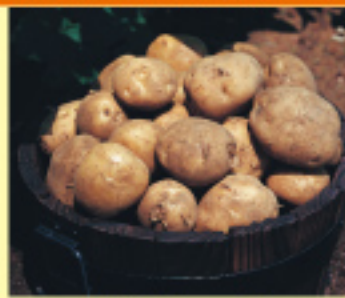
014 だんしゃく 1kg 400円 発送時期/10月～4月