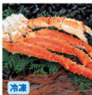
017 本タラバ足 ポイル 約800g 5,000円