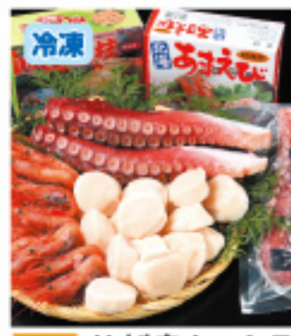
026 お刺身セットB 北海甘えび500g・ほたて貝柱500g 真だこ足500g 5,800円