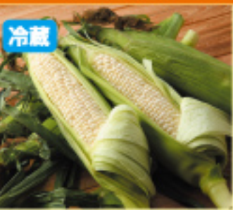
013 ピュアホワイト 2本 700円 発送時期/8月～9月中旬