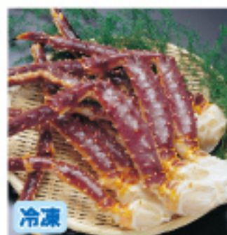
018 本タラバ足 生 約800g 5,000円