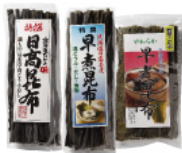
032 日高昆布3本セット 日高昆布・早煮昆布・やわらか昆布 2,100円