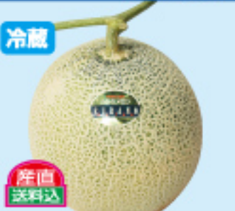
009 富良野メロン 2玉 5,500円 発送時期/8月～