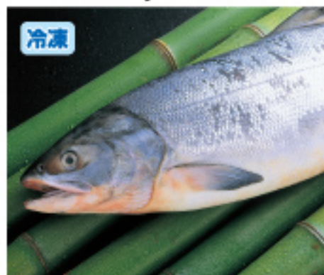
045 新巻鮭 1本・約2kg以上 3,000円