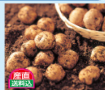
011 北あかり 10kg 3,500円 発送時期/10月～