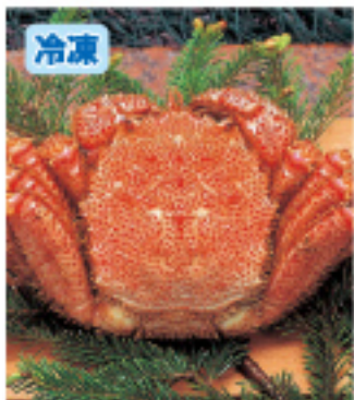
043 毛がに 1尾・約400g 2,800円