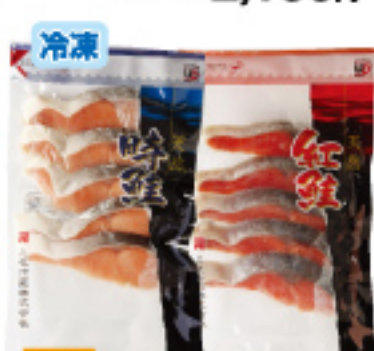
040 時鮭切身・紅鮭切身 各5枚 2,100円