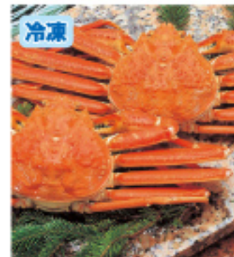
044 ズワイ姿 1尾・約600g 2,800円