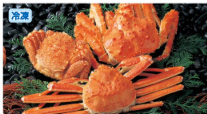
001 三大がにセット 本タラバ姿1尾・約700g、毛がに1尾・約400g ズワイ姿1尾・約600g 8,000円