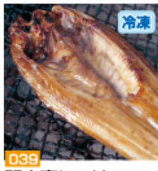
039 開き真ほっけ 3枚 特大しまほっけ 1枚 2,100円