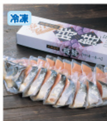
004 特選時鮭切身 約2.3kg 6,500円