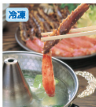
027 生タラバの しゃぶしゃぶ 約500g 3,900円