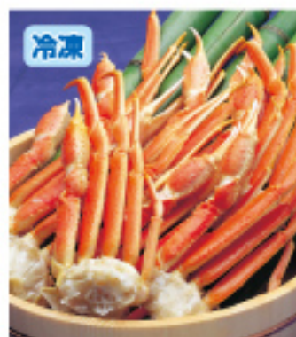
003 ポイルズワイ足 約2kg 7,000円