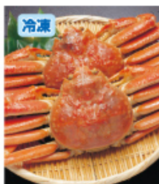
020 スワイ姿 2尾・約1.2kg以上 5,200円