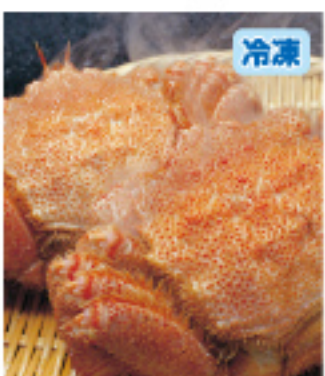
021 毛がに 2尾・約800g以上 5,200円