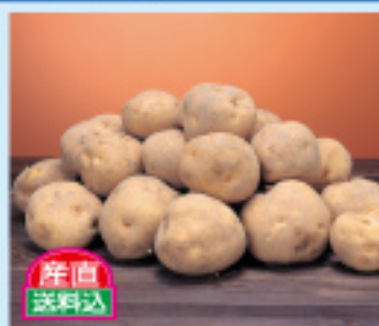
010 だんしゃく 10kg 3,000円 発送時期/10月～