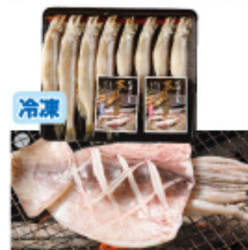
041 焼き物セット 本ししゃも(オス・メス各5尾) いか一夜干し 2,300円