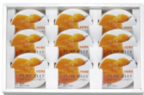
046 ホリタ張メロンピュアゼリー 9個入 1,890円