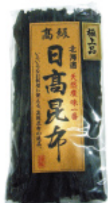
031 極上日高昆布 300g 1,500円