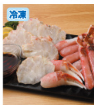
028 生ズワイの しゃぶしゃぶ 約500g 3,900円