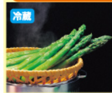
012 グリーンアスパラ 2束 700円 発送時期/5月末～6月末